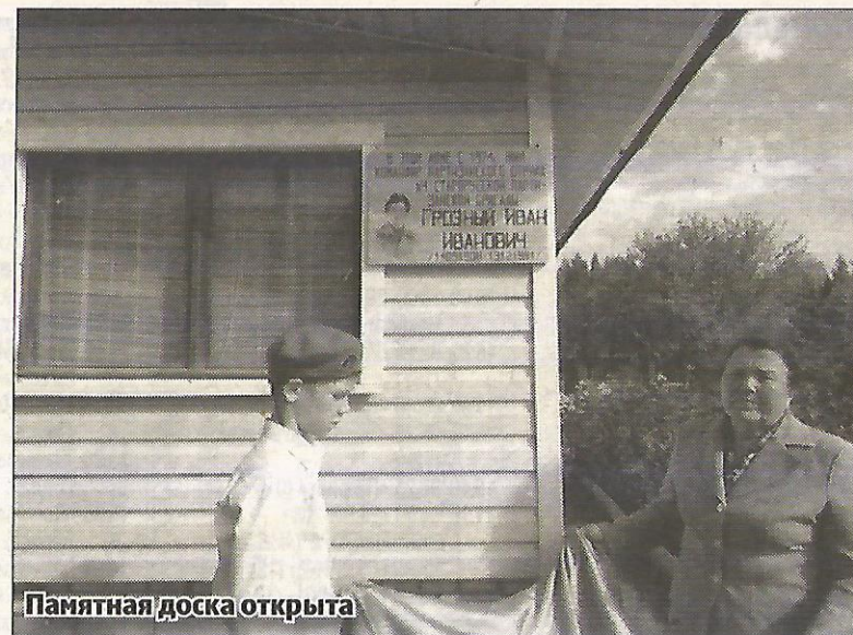
Памятная доска открыта