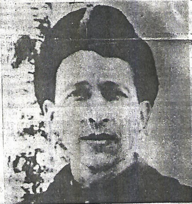
смельчаков советских горсть.

— Однажды разведка до несла, что фашисты эвакуиро вали мирное население из д. Лукино, Воронцово, Мануй лово и разместили штабы с рациями и телефонами. В выполнении задания по