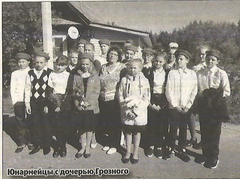
Юнармейцы с дочерью Грозного